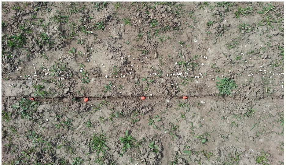
Abb. 5: Unterfußdüngung Mais zur Dokumentation der Düngerkörnerverteilung mit 2 dt/ha Düngermischung DAP + ESTA Kieserit

In weiteren ähnlich gelagerten Fällen waren Spurennährstoffe mit Zink, Bor und Mangan wie z. B. in Form von 50 kg/ha Ex-cello 331 als Zumischung zu NP-Düngern ertragswirksam. Diese Form der Optimierung wird angesichts hoher Naturalerträ-