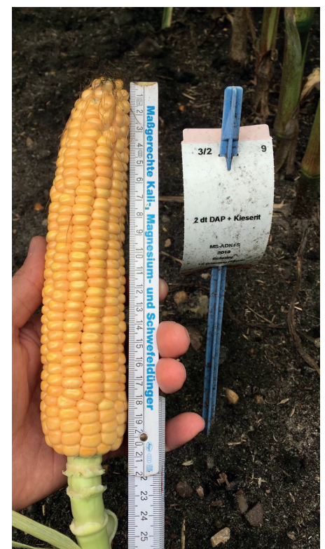
Abb. 4: Maiskolben aus der Versuchsvariante mit der Mischung DAP + Kieserit.

Der Sachverhalt wird noch einmal belegt, wenn man die Erträge als entscheidende Größe zugrunde legt. In entspre-